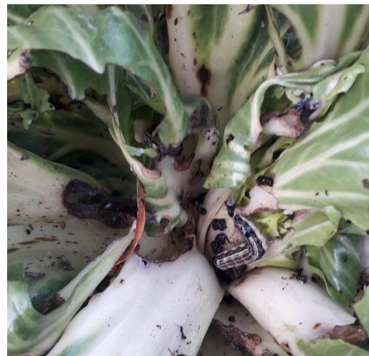
Noctuelle sur mini blette en plein champs