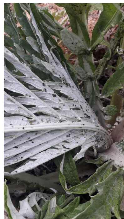
Pucerons sur artichaut

Plus d'informations sur la fiche technique « Salade d'abris en Provence – se protéger des pucerons »