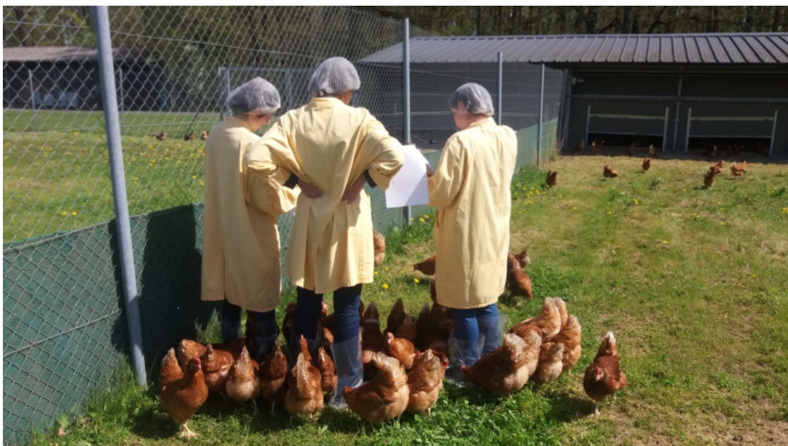
Les relevés dans les élevages ont été réalisés quotidiennement

La quantité d'aliment ingérée n'a pas été significativement différente entre le 95-AB et 100-AB. Par ailleurs la production d'œufs globale, ainsi que le poids moyen des œufs et la proportion d'œufs cassés, piqués ou mous n'ont pas été statistiquement différents entre les deux traitements.