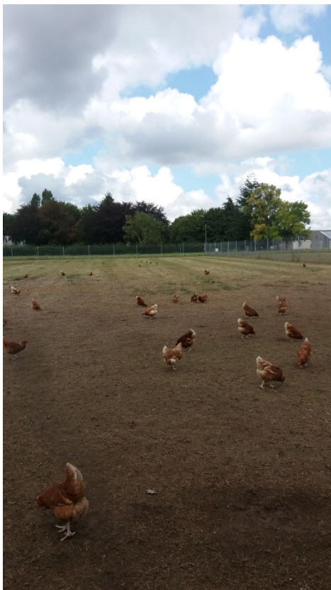
Les poules ont libre accès en journée (11h à la tombée de la nuit) aux parcours engazonnés de façon identique pour chacun des lots.

Les élevages de volailles AB sont soumis aux règlements (CE) 834/2007 et (CE) 889/2008. Une dérogation, prenant fin au 31 décembre 2020, permet encore d'introduire jusqu'à 5 % de matières premières végétales conventionnelles dans l'alimentation des poules pondeuses biologiques. C'est donc dans ce contexte que les essais ont été menés au sein de l'INRA de Nouzilly (dans le cadre du projet Secalibio 1 ). Les objectifs étaient de proposer un aliment pour poules pondeuses, 100% biologique, performant techniquement, économiquement et au regard du bien-être animal. Deux stratégies alimentaires ont donc été testées, une 95 % AB avec des aliments contenant 95 % de matières premières végétales issues de l'AB, représentatif de la pratique actuelle (Témoin) et une 100 % AB avec des aliments contenant 100 % de matières premières végétales issues de l'AB (Test). L'aliment 100% AB, formulé de façon à répondre au mieux aux besoins des poules pondeuses, a permis de maintenir la qualité des œufs. Cependant, l'aliment 100 % AB reste plus cher que l'aliment 95% AB avec une augmentation du prix de 1,5 % pour l'aliment début de ponte et de 0,4 % pour l'aliment milieu de ponte.